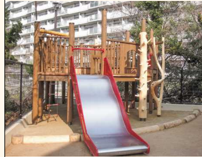
■園庭の木製遊具に

人間に個性があるように、木材にも個性があります。面白い杢目や個性的な特徴を活かした製品創りが徳田銘木の得意とするところです。