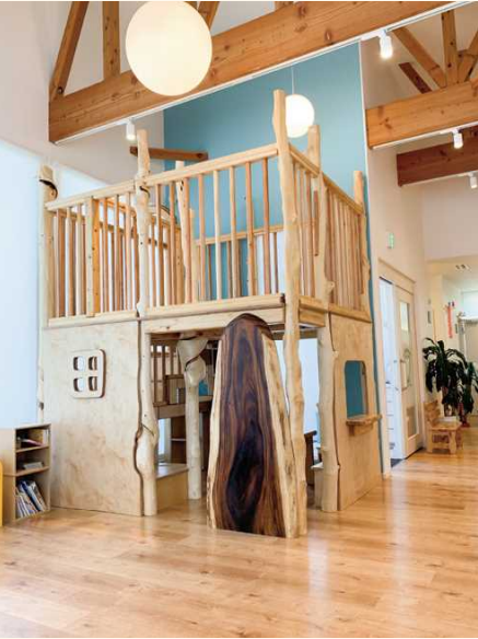
■歯科医院の待合室のスペースとして

伝統銘木は、床の間、和室、数寄屋建築等、日本の昔ながらの銘木類です。最近では洋風建築や商業建築など、いろいろな空間で楽しまれています。