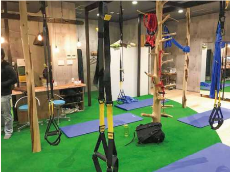
■介護施設のリハビリルームに