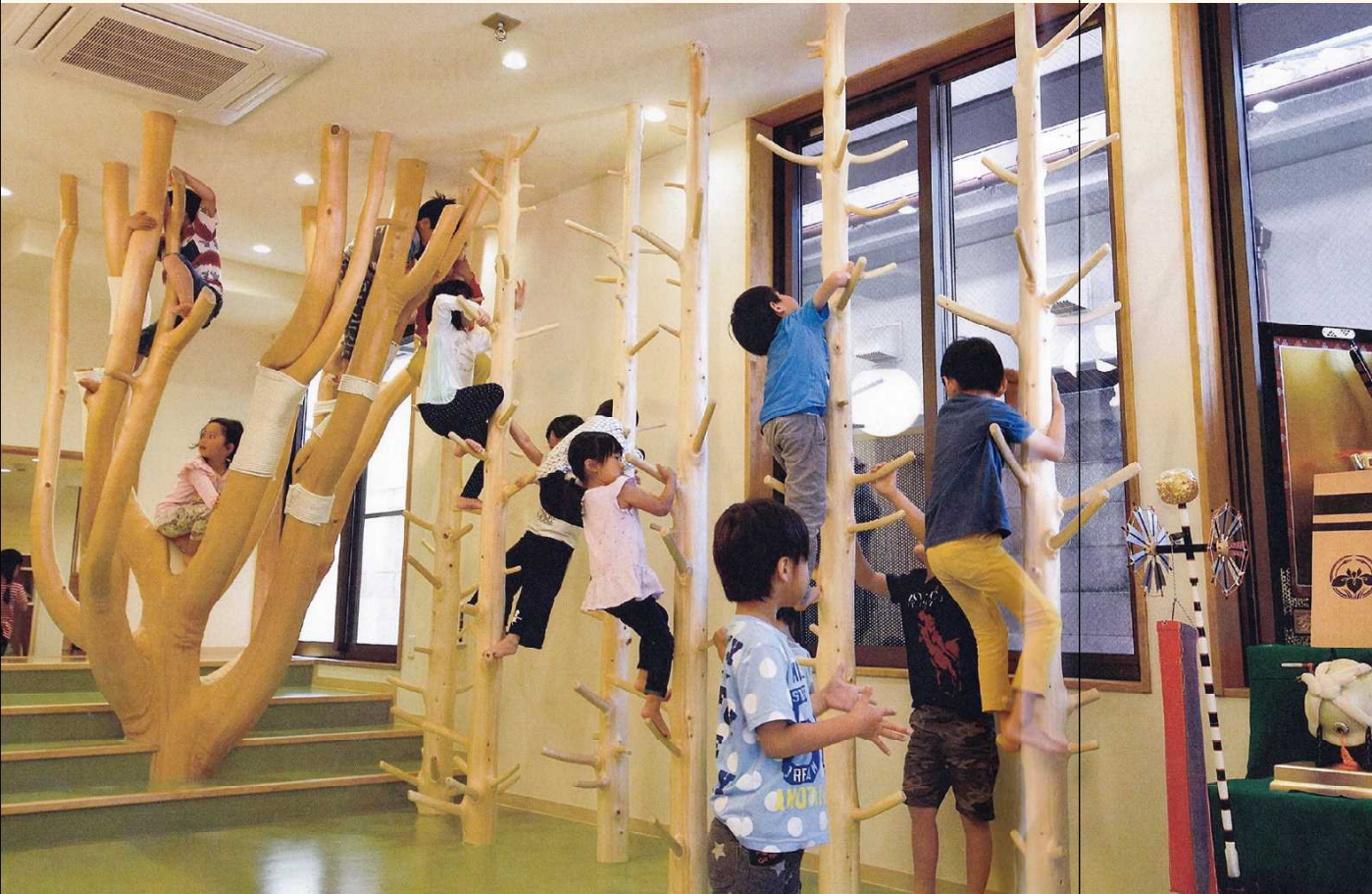
■自然木を活かした木登り棒