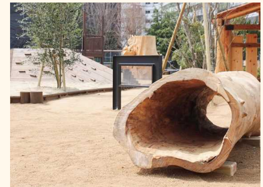
■自然木を活かしたトンネル