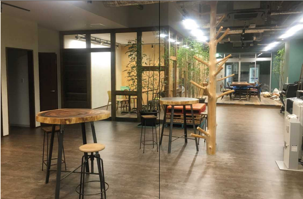
■オフィスの柱やテーブルに