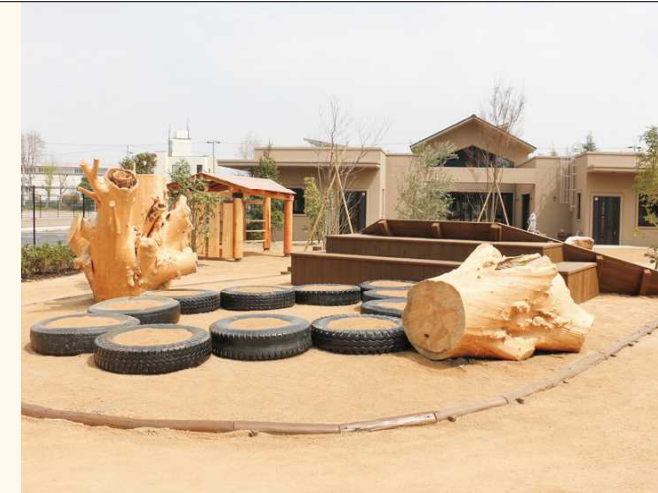
■自然木を活かした園庭