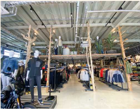
■店舗の商品ディスプレイに