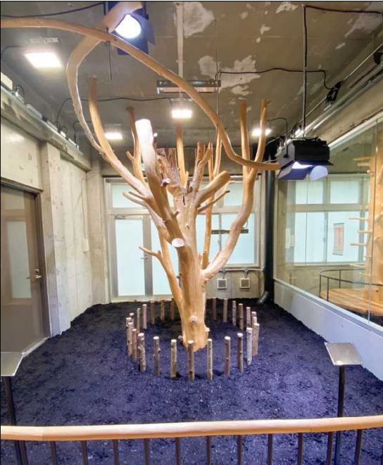
■テーマパークの動物の遊具